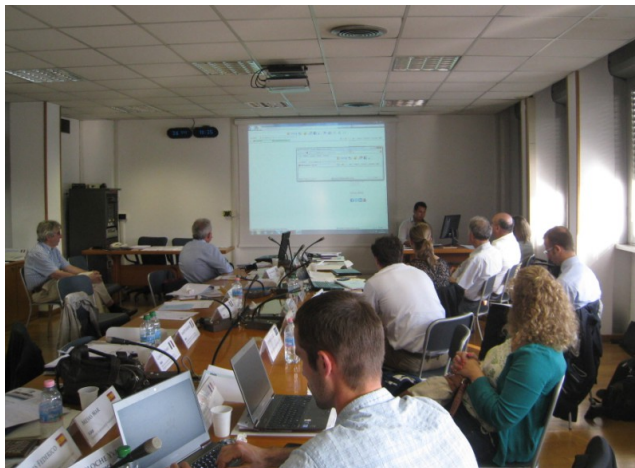
Početni sastanak 26./27. lipanj, 2013. Rim (Italija) Domaćin: ENEA